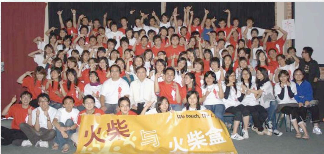
2007年青令 - 火柴與火柴盒